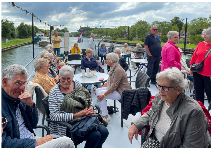
Op onze website www.seniorenverenigingmaarde.nl vindt u nog enkele foto's van deze mooie tocht.