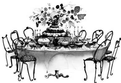
Lunch cadeau bon

Voor een bon voor het Eetpunt of de Lunch op zondag betaalt u € 6 en de bon voor het kienen geeft u cadeau voor €5.